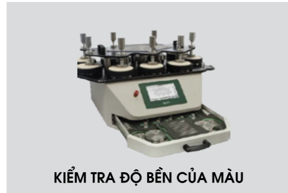
KIỂM TRA ĐỘ BỀN CỦA MÀU