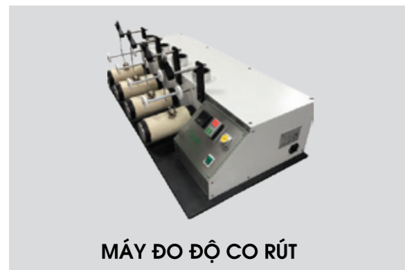
MÁY ĐO ĐỘ CO RÚT