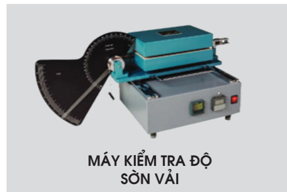
MÁY KIỂM TRA ĐỘ SỜN VẢI