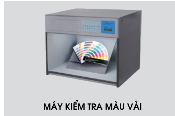
MÁY KIỂM TRA MÀU VẢI

Chất lượng sản phẩm là nền tảng để chinh phục khách hàng, vì vậy chúng tôi rất lưu tâm tới việc kiểm soát chất lượng sản phẩm từ nguyên phụ liệu đầu vào cũng như chất lượng sản phẩm đầu ra. Vì thế chúng tôi đã và đang đầu tư vào các trang thiết bị kiểm định chất lượng sản phẩm cũng như nhân sự kiểm soát chất lượng sản phẩm để đảm bảo sản phẩm đạt chất lượng trước khi đến tay khách hàng.