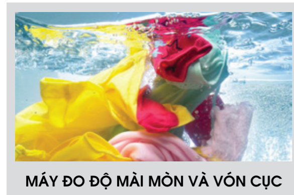
MÁY ĐO ĐỘ MỀM MÒN VÀ VÓN CỤC