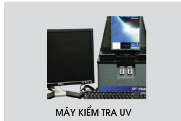
MÁY KIỂM TRA UV